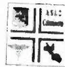
ASP n° 2